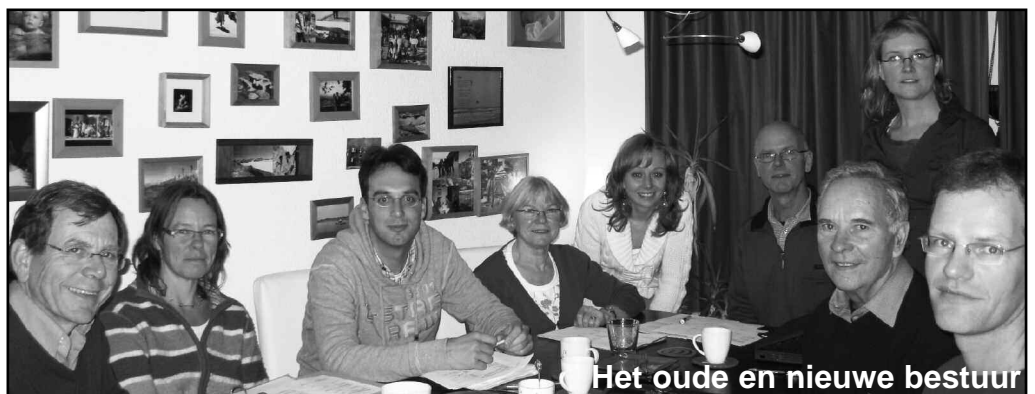
Het oude en nieuwe bestuur

Ik hoop dat wij het door jullie gegeven vertrouwen goed kunnen waar maken. Gelukkig hebben jullie aangegeven dat wij jullie nog af en toe om raad mogen vragen.