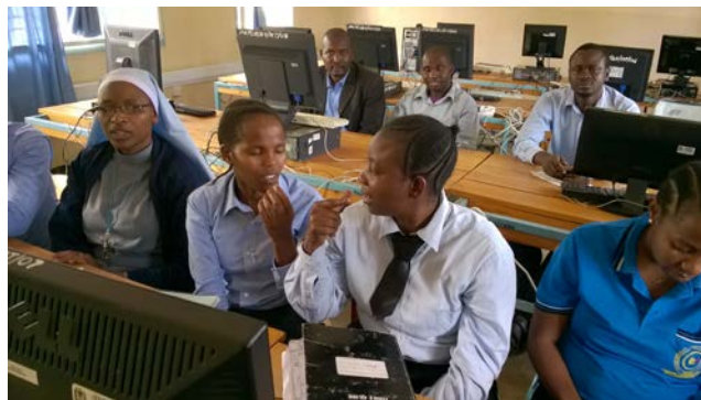
Studenten oefenen klankgebaren in ICT-lokaal

Achtendertig studenten kregen een dag les van het hele team over gehooronderzoek, spraak horen en uiten, klankgebaren, testmateriaal ontwerpen, inzet van filmpjes. Dagelijks ook nog een uur van de drie Tanzaniaanen en tutoren. Een slechthorende tutor kreeg een luisterhulp waarmee ze tijdens vergadering-en en lessen beter kan spraak verstaan. Als rolmodel op PTC kan ze haar ervaringen delen met horende en slechthorende mensen.