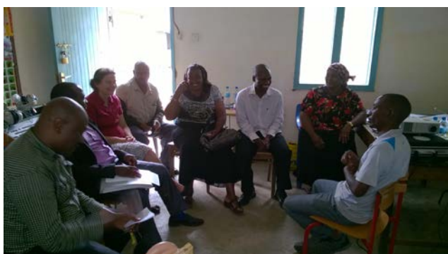
Dagelijks overleg met tutoren, het Tanzaniaanse en Nederlandse Shubi team, buiten beeld: Suzanne, Hans, Gertjan

Achtendertig studenten kregen een dag les van het hele team over gehooronderzoek, spraak horen en uiten, klankgebaren, testmateriaal ontwerpen, inzet van filmpjes. Dagelijks ook nog een uur van de drie Tanzaniaanen en tutoren. Een slechthorende tutor kreeg een luisterhulp waarmee ze tijdens vergadering-en en lessen beter kan spraak verstaan. Als rolmodel op PTC kan ze haar ervaringen delen met horende en slechthorende mensen.