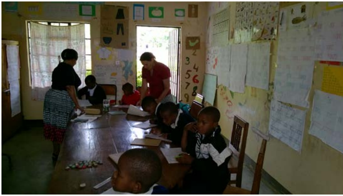
Groep 1 van Patandi unit: kinderen zonder hoortoestellen. Overal hangen woordjes en plaatjes: "talking classroom"