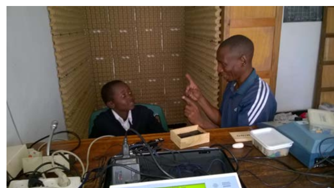
Ally legt uit hoe doof kind kan leren reageren op geluid